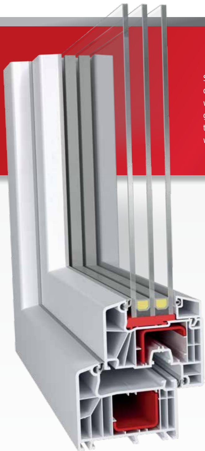
IDEAL 7000 Classic-line | 85 mm

Seria IDEAL 7000 to przykład synergicznego wykorzystania właściwości profili i szyb zespolonych w celu tworzenia okien charakteryzujących się bardzo niską przenikalnością cieplną. Uzyskany w badaniach współczynnik przenikalności cieplnej profili o wartości do U_f=1,1 W/m 2 K w połączeniu z możliwością stosowania szerszych i cieplejszych pakietów szybowych o szerokości do 51 mm gwarantuje najlepsze parametry cieplne okna.