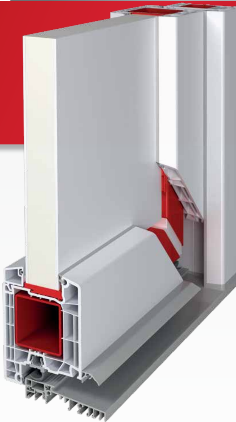
Drzwi zewnętrzne IDEAL 7000 | 85 mm